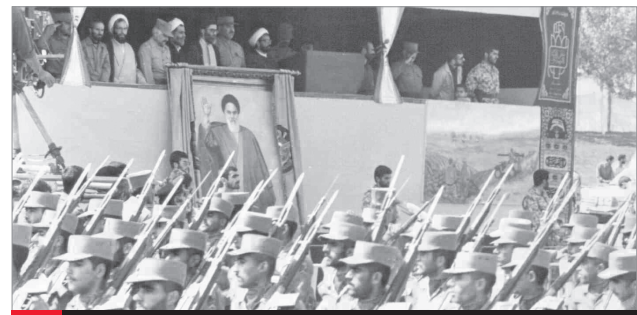
رژه نظامی نیروهای پیاده و ویژه ارتش جمهوری اسلامی، شهریور ۱۳۶۴ انتشار بمناسبت ۱۹ فروردین روز ارتش جمهوری اسلامی

سلام. خدا را شاکریم که توفیق داد ۲۶۰۰ عدد از اولین شماره نشریه خط حزب... منتشر شده سال ۹۶ (شماره ۷۵) در مساجد، نمازهای جمعه، جلسات قرآن و نهج البلاغه شهر اصفهان و شهرهای اطراف توزیع نماییم. ●