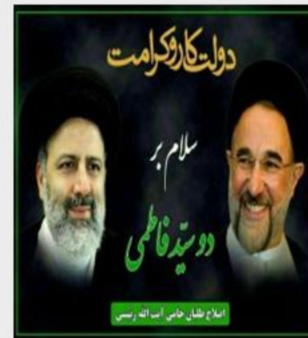
برگزار خواهد شد.

شب گذشته جمعی از اصلاح طلبان کشور ستاد و پویشی برای حمایت از آیت الله رئیسی در انتخابات ریاست جمهوری پیش رو راه اندازی کردند. امروز جبهه پایداری رسما از سید ابراهیم رئیسی اعلام حمایت کرد. محمدرضا باهنر هم از تشکیل ستاد حمایت از آیت الله رئیسی در این تشکل سیاسی خبر داد. سعید محمد هم به همراه اعضای ستاد انتخاباتی خود با سید ابراهیم رئیسی دیدار کرده و از آمادگی کامل ستادهای انتخاباتی خود برای فعالیت در حمایت از سید ابراهیم رئیسی خبر داد. فردا دوشنبه هم جلسه ۳۰ نفر از نمایندگان ادوار مجلس در قالب ستاد خادمان ملت با سید ابراهیم رئیسی برگزار خواهد شد.