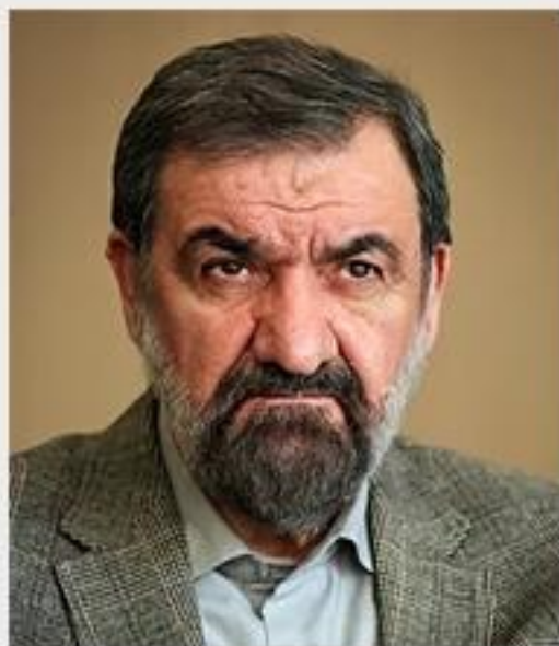
فراهم خواهیم کرد.

محسن رضایی تاکید کرده است که باید پول ملی ایران تقویت شود تا در کنار دلار و یورو قویترین پول منطقه شود. رضایی گفت: به آن ها قول دادم در صورت موفقیت در انتخابات، زمینه سرمایه گذاری مالی و حضور معنوی آن ها در کشور را فراهم خواهیم کرد.