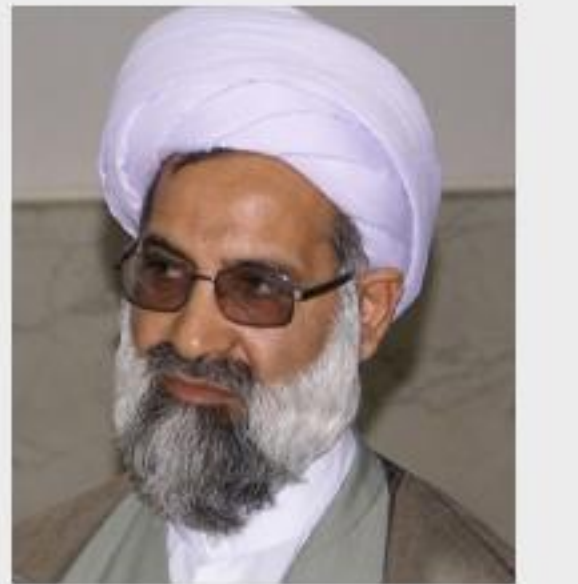
و رانت خواران باشد.