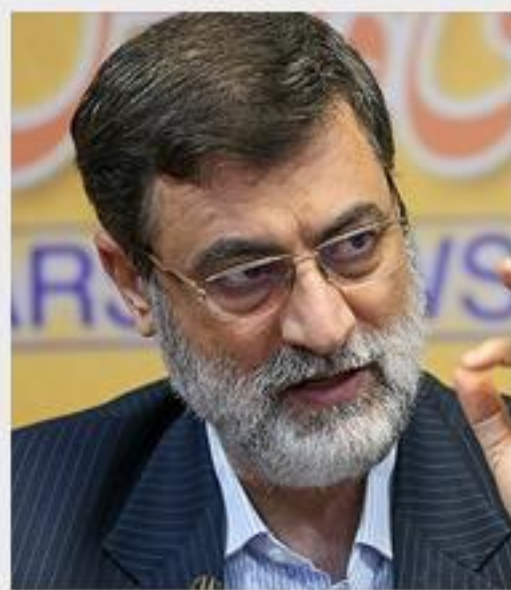
کاهش می یابد.

قاضی زاده هاشمی وعده داده است که در حوزه اصلاحات ساختار و نهادی اقتصادی ظرف چهار سال نه تنها نرخ تورم را کاهش می دهد بلکه تک رقمی می کند و به زیر پنج درصد می رساند. وی تصریح کرده است که تورم در سال اول به نصف