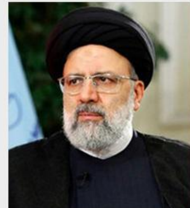
کاندیدای ریاست جمهوری سیزدهم در همین راستا تاکید کرد: باید استفاده از اینترنت برای دهک های پایین رایگان شود.

آیت الله رئیسی عدالت را موضوعی محوری در دولت مردمی دانست و افزود: اگر ظرفیت ها درست توزیع شود نگرانی جوانان برطرف می شود و این از برنامه های مهم ماست که با حل مسأله مسکن، اشتغال و تولید در کشور، به مردم آرامش دهیم. وی درباره برنامه های دولتش برای اینترنت و فضای مجازی هم گفت: اینترنت و فضای مجازی تمام لایه های زندگی ما را تحت تاثیر قرار داده و هیچ ساخته بشری به این سرعت فراگیر نشده است. آیت الله رئیسی افزود: امروز اینترنت به حق مردم تبدیل شده و مسائل آموزشی و اقتصادی و تحقیق و پژوهش در اقصی نقاط کشور در بستر فضای مجازی انجام می شود. کاندیدای ریاست جمهوری سیزدهم در همین راستا تاکید کرد: باید استفاده از اینترنت برای دهک های پایین رایگان شود.