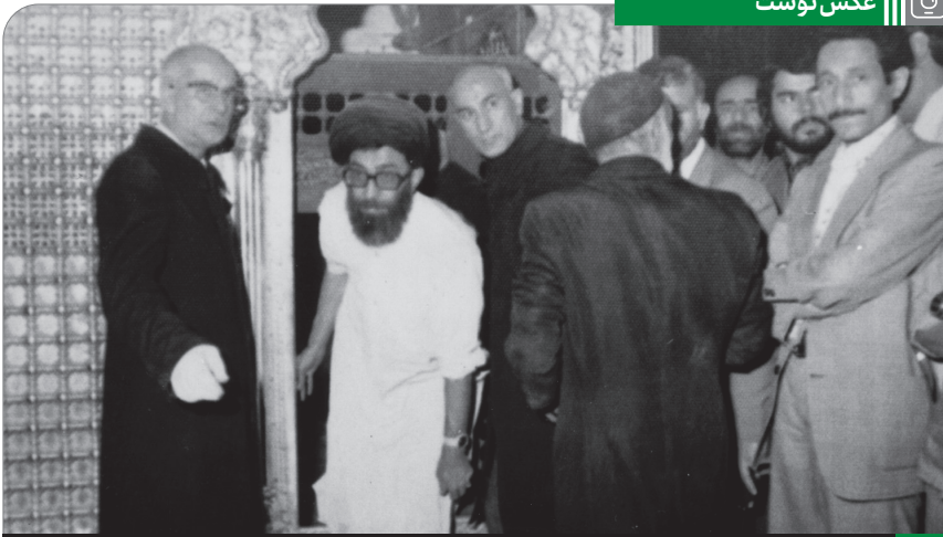
تصویری از آیت‌الله خامنه‌ای در مراسم غبارروبی مضجع مطهر امام رضا (ع)