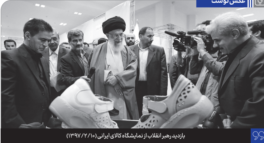
بازدید رهبر انقلاب از نمایشگاه کالای ایرانی (۱۳۹۷/۲/۱۰)

مباهله... در واقع مظهر اطمینان و اقتدار ایمانی و تکیه بر حقاقت است و این، آن چیزی است که ما همیشه به آن احتیاج داریم. امروز هم ما احتیاج داریم به همین اقتدار ایمانی و همین تکیه بر حقاقت خودمان؛ چون در راه حق داریم حرکت میکنیم، به این باید در مقابل دشمنی دشمنان و دشمنی استکبار تکیه کنیم و الحمد لله تکیه هم میکنیم؛ از این جهت، ملت ایران، افکار عمومی، سرجمع گرایشهای مردمی کشور ما همین است که چون حقتند، چون در راه درست دارند حرکت میکنند، یک اطمینان عمومی ای بحمد الله وجود دارد. سوره ی هل آتی هم مظهر برکت یک کار مخلصانه است؛ یک ایثار مخلصانه که خدای متعال به خاطر این ایثاری که اهل بیت انجام دادند، یک سوره نازل کرد در حق اینها. ● ۲۴ ذی الحجه روز مباهله و ۲۵ ذی الحجه، روز نزول آیه هل آتی، گرامی باد.