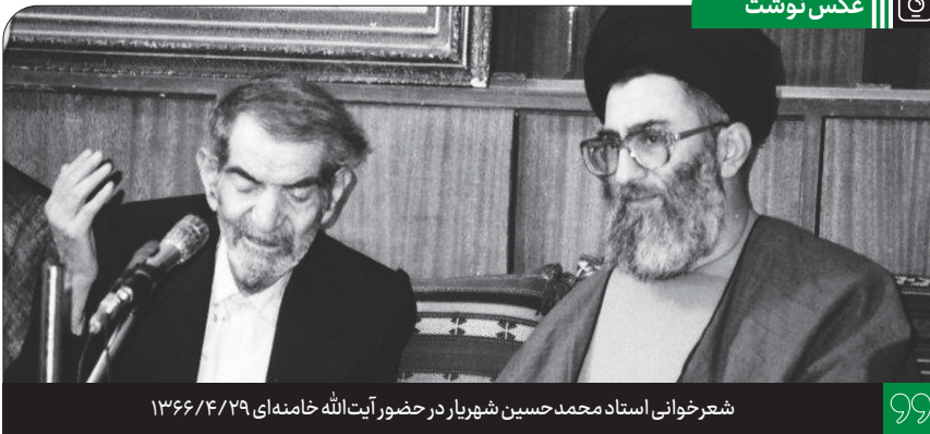
شعرخوانی استاد محمد حسین شهیرار در حضور آیت الله خامنه‌ای ۱۳۶۶/۴/۲۹

راه پیمایی اربعین قوّت اسلام است، قوّت حقیقت است، قوّت جبهه‌ی مقاومت اسلامی است که این جور اجتماع عظیم میلیونی راه می‌افتند به سمت کربلا، به سمت حسین، به سمت قلّه‌ی او ج افتخار فد اکاری و شهادت که همه‌ی آزادگان عالم باید از او درس بگیرند. از روز اوّل هم که اربعینی به وجود آمد، اهمّیت اوّلین اربعین به همین اندازه بود. اهمّیت اربعین اوّل این بود که رسانی پُر قدرت عاشورا است. از روز عاشورا تا روز اربعین - بنا بر یک روایت روزی است که اهل بیت برگشتند به کربلا - این چهل روز، چهل روز فرمانروایی منطبق حق در میان دنیای ظلمانی حاکمیت بنی امیّه و سفیانی‌ها بود. رسانی حقیقی [یعنی] فریاد زینب کبری، فریاد حضرت سجّاد، در کجا؟ در کوفه، در شام، در آنجایی که ظلمات محض بود؛ اینها بزرگ‌ترین رسانه بود. همینها بود که عاشورا را نگه داشت، همینها بود که عاشورا را به امروز رساند. تاریخ و ریشه‌ی این روز اربعین و ماجرای اربعین این است. آن روز اهل بیت علیهم‌السلام طوفانی به پا کردند با این حرکت چهل روزه؛ یک طوفان به باشد در آن اختناق عجیب. ● ۱۳۹۸/۷/۲۱