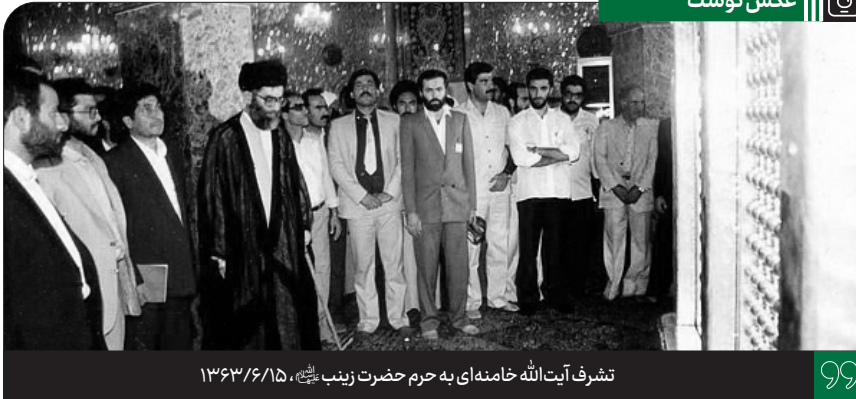
تشریف آیت الله خامنه ای به حرم حضرت زینب علیها السلام ، ۱۳۶۳/۶/۸۵